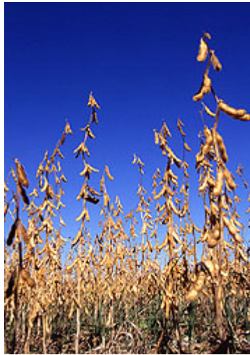
Sojafeld (bot.: Glycine max. )

in speziell angepassten Motoren Einsatz finden kann. Der hohe Gehalt an Phospholipiden macht eine Raffination unumgänglich. Die Hauptanbaugebiete liegen in Osteuropa, Mittel- und Südamerika.