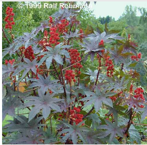
Rizinusstrauch (bot.: Ricinus communis L.)