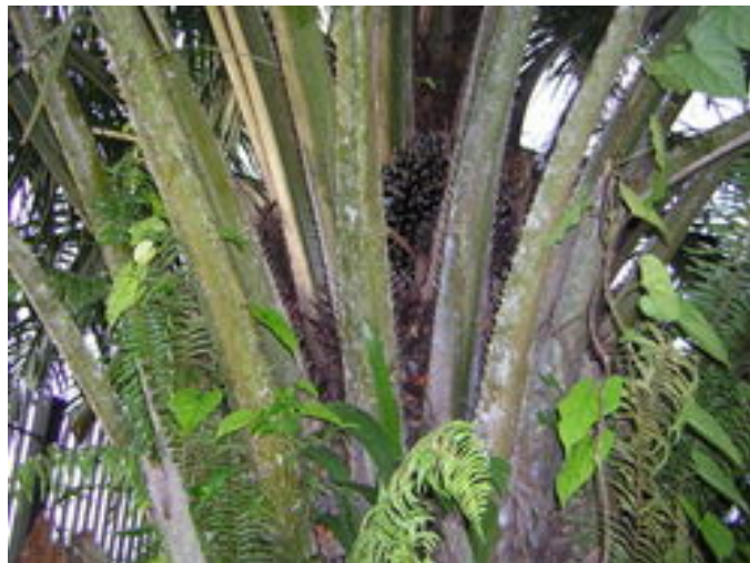
Ölpalme (bot.: Elaeis guineensis )

Palmöl wird aus dem Mesokarp der Frucht der Ölpalme gewonnen. Die Frucht der Ölpalme wächst in 4 - 20 kg schweren Bündeln die zwischen 200 und 2000 Früchte enthalten. Die Majorfettsäuren des Palmöls sind Palmsäure und Ölsäure, zu jeweils etwa 40 - 45 %. Der hohe Gehalt an Palmsäure bewirkt, das Palmöl bei Raumtemperatur nahezu fest ist. Unbearbeitetes Palmöl ist wegen seines hohen Gehaltes an Carotinoiden rot. Die Hauptanbaugebiete liegen in Afrika, Südostasien und Amerika. Probleme beim Einsatz von unraffiniertem Palmöl in Motoren sind unter anderem die hohe Viskosität sowie der oftmals sehr hohe Gehalt an freien Fettsäuren, die Korrosion am Einspritzsystem und im Brennraum zu Folge haben können.