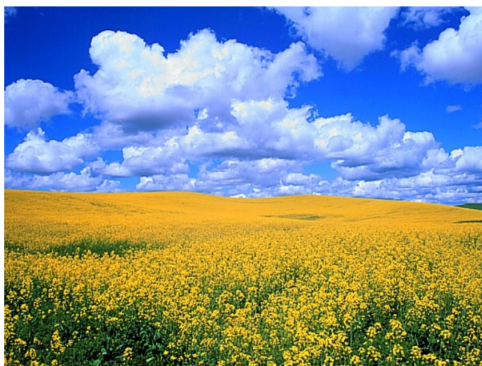
Rapsfeld (bot.: Brassica napus L.)

In Deutschland und Europa ist Raps die am häufigsten angebaute Ölfrucht. Abhängig von der Sorte und den Anbaubedingungen werden Hektar-Erträge zwischen 2000 und 5000 kg Öl erzielt. Der mittlere Ölgehalt der seit 1985 auf dem Markt befindlichen 00-Sorten (erucasäurearm und geringer Gehalt an Glucosinolaten) liegt bei etwa 43 %. Der proteinreiche Presskuchen aus der Ölgewinnung findet vor allem als hochwertiger Rohstoff in der Futtermittelindustrie Verwendung. Um den Einsatz als Kraftstoff voranzutreiben, wurde in mehreren LTV-Arbeitskreisen ein Qualitätsstandard für Rapsöl als Kraftstoff aufgestellt. Hier wurden mit Beteiligung von Motorenherstellern, Analyseinstituten und Forschungseinrichtungen unter Federführung der Bayerischen Landesanstalt für Landtechnik bestimmte chemisch / physikalische Parameter definiert. Im Juni 2005 wurde der Entwurf der „E DIN 51605 2006-06 - Kraftstoffe für pflanzenölaugliche Motoren - Rapsölkraftstoff - Anforderung“ der Öffentlichkeit zur Prüfung und Stellungnahme vorgelegt. Es kann davon ausgegangen werden, dass diese Norm den RK-Qualitätsstandard in naher Zukunft ablösen wird. Rapsöl eignet sich hervorragend für den Einsatz in Motoren die an Pflanzenöle angepasst wurden. Aufgrund des steigenden Bedarfs und der begrenzten Anbauflächen in Deutschland und Europa kommen auch zunehmenden außereuropäische Pflanzenöle auf den Kraftstoffmarkt.