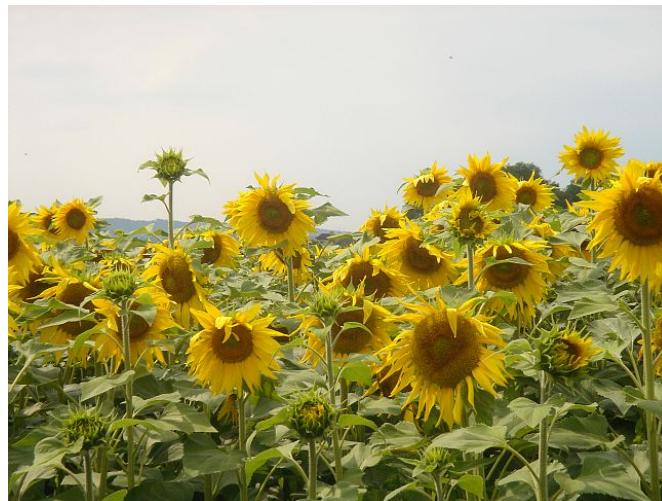
Sonnenblumenfeld (bot.: Helianthus annuus L.)

Das Sonnenblumenöl ist ein aus den Samen der Sonnenblume gewonnenes Pflanzenöl, das hauptsächlich in der Ernährung Anwendung findet. Sonnenblumenöl ist nach der Raffination eine klare, helle, goldgelbe Flüssigkeit, die auch hervorragend für den Einsatz in Verbrennungsmotoren geeignet ist. Der hohe Vitamin E Gehalt des Sonnenblumenöls schützt das Öl vor oxidativer Schädigung und macht es damit im Vergleich zu anderen Ölen lagerstabiler. Ein weiterer Vorteil ist der niedrige Gehalt an freien Fettsäuren, der die Motorkorrosion gering hält. Haupterzeuger sind Osteuropa und die USA.